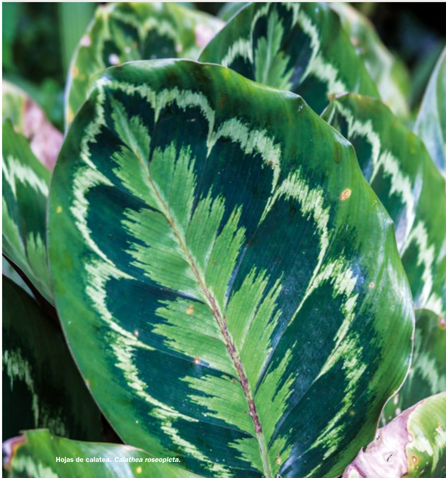
Hojas de calatea. Calathea roseopicta .